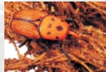
Tavola Rotonda Il Rhynchophorus ferrugineus in Italia e nel Mediterraneo: Stato dell'arte e prospettive di

Istituto Agronomico Mediterraneo di Bari